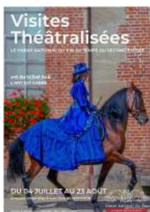
Visite Théâtralisée Tous les samedis et dimanches à 14h