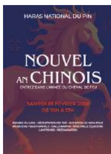
Nouvel An Chinois 28 février 2026