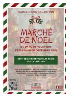
Marché de Noël Les week-ends : 27 au 29 nov. 4 au 6 déc. 2026