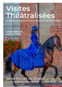
Visite Théâtralisée Tous les samedis et dimanches à 14h