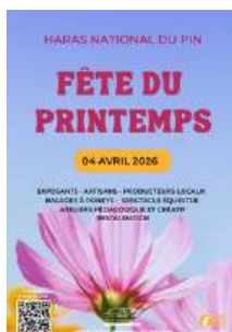
Fête du Printemps 04 avril 2026