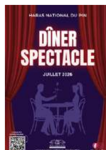
Dîner Spectacle Date à venir

Notre escape game "Les Flamboyants éperons d'or", un jeu immersif au coeur des écuries historiques, est à retrouver chaque vacances scolaires. Dates et réservation sur : www.haras-national-du-pin.com