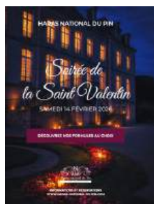
Saint Valentin 14 février 2026