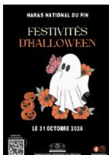
Festivités d'Halloween 31 octobre 2026